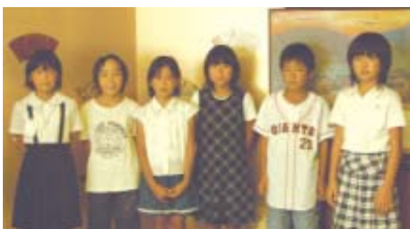
授賞式に出席した特選の皆さん