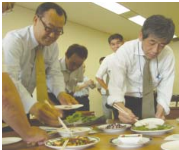
並べられた料理を試食する協議会員たち

市は、農業、環境、観光の三部門が共同することで、市内の生ごみや家畜の排せつ物を再資源化して、野菜の有機栽培を行い、観光振興や安全な食による健康を