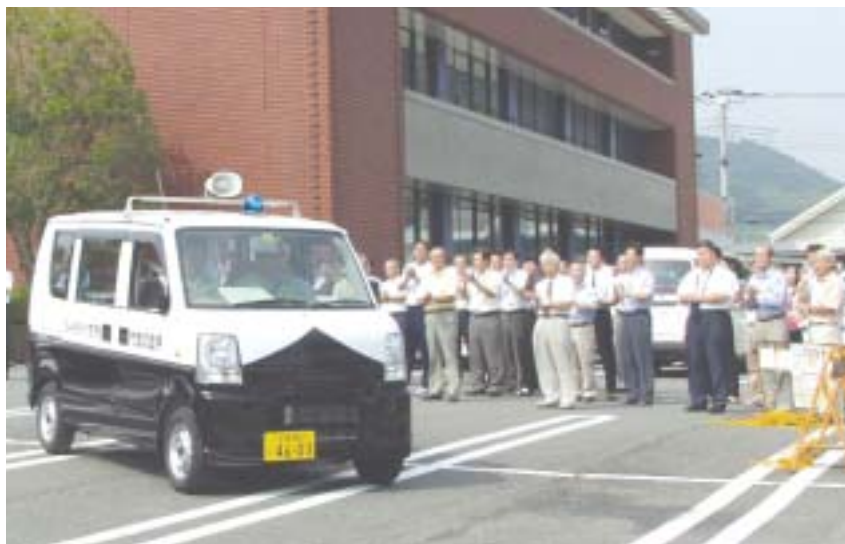
出発式を終え、早速パトロールに走り出す青色回転灯パトロール車（伊豆長岡庁舎駐車で）

八月十一日、伊豆長岡庁舎駐車で青色回転灯パトロール車の出発式を行いました。パトロール車は、軽自動車やバンタイプの公用車三台を白と黒のツートンカラーでパトカーのような外観に仕立てたもの。安全対策課（伊豆長岡庁舎）と韮山・大仁支所の地域振興課に配置し、この日