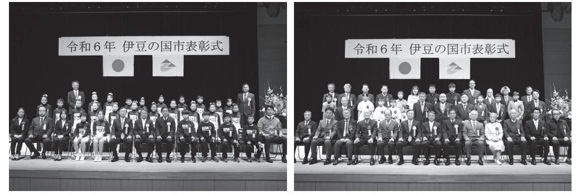
表彰を受けた皆さん