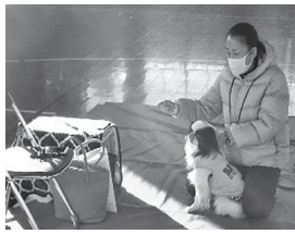
▶ペットの災害対策研修会

不妊手術の実施(手術を受けたしるしとして耳の先端がV字にカットされています)、決まった時間のエサやり、食べ残しの後片付けなど、猫の周辺環境が適正に管理されている場合はその世代までの命として市民の皆さんの見守りへのご理解・ご協力をよろしくお願います。