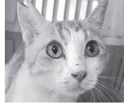
◀不妊手術後は写真のような耳の切れ込みがあります