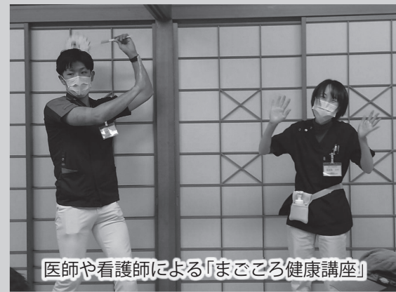
医師や看護師による「まごころ健康講座」

大仁まごころ市場では、健康的なまちづくりを推進するために、伊豆保健医療センターと協働し、まごころ市場出荷者や家族を中心とした地元の人に対して「まごころ健康講座」を定期的に開催しています。医師たちが寸劇を交え、膝痛予防やもの忘れ予防などの講話を展開しています。 また、まごころ市場では「安心・安全・新鮮」プラス「健康」を合言葉に、市内・近隣で生産した農産物を販売しています。新鮮・安心は地