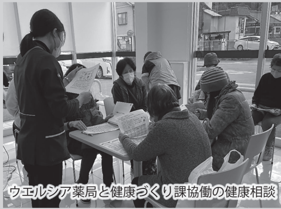
ウエルシア薬局と健康づくり課協働の健康相談

また、ウエルシア薬局伊豆長岡店と協働し、血圧測定、みそ汁塩分濃度測定、お塩のとりかたチェック、たばこに関する相談、管理栄養士・歯科衛生士や薬剤師による講話、骨強度測定、体組成測定、健康相談などを定期的実施しています。 今月は、8月21日(月)14時~15時30分に開催します。