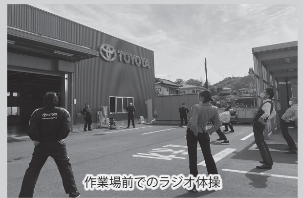
作業場前でのラジオ体操

トヨタユニテッド静岡伊豆の国店では、始業前に全員でラジオ体操を行っています。毎日続けることで作業中の事故予防や健康管理だけではなく、スタッフ間のコミュニケーションづくりのきっかけにもなっています。 水曜日毎朝9時より、作業場前で行っています。地域の皆様のご参加も大歓迎です。一緒にラジオ体操をして、気持ちの良い1日のスタートを切りませんか。