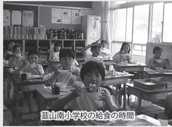
菰山南小学校の給食の時間

「ふるさと給食週間」は安心・安全な食べ物を提供してくれる生産者と豊かな食文化を形作ってきた地域の人たちへの感謝の気持ちや、子どもたちの健やかな心と身体を育てています。 今年のふるさと給食では伊豆の国市内産のミニトマトと玉ねぎが登場しました。