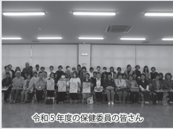
令和5年度の保健委員の皆さん

地域の健康づくりの担い手である保健委員の皆さん。地域と行政をつなぐパイプ役として、行政で実施している健康づくり事業のPRなどを行っています。研修会で学んだ知識を身近な人たちに伝えたり、自分や家族の健康を考えることが、地域の中での健康づくりの活動に生かされています。 今年度は、健康マイレージ事業の普及だけでなく、健康づくりに特化したウォーキング&サイクリングマップづくりへも参画しています。