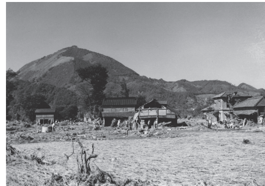
▲被害を受けた家屋と田畑(白山堂)

昭和33年(1958)9月26日に伊豆半島を襲った台風22号は狩野川流域に1時間80～120ミリの猛烈な雨を降らせ、濁流となった狩野川は田方平野に甚大な被害をもたらしました。いわゆる『狩野川台風』です。その発生から今年で65年が経ちます。狩野川台風は、田方平野の生活を一夜にして一変させ、その後の産業やまちづくりには大きな影響を与えました。