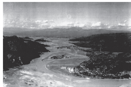
▲台風直後の熊坂から大仁方面