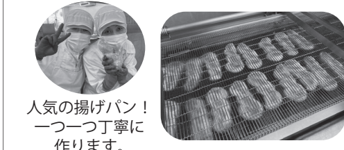
人気の揚げパン！ 一つ一つ丁寧に作ります。