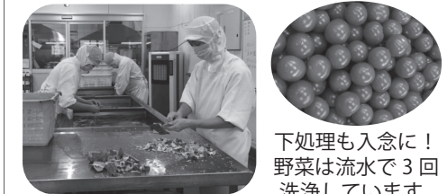
下処理も入念に！ 野菜は流水で3回洗淨しています。