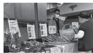
椎茸、黒糖麩菓子を購入できます