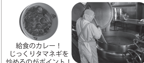
給食のカレー！ じっくりタマネギを炒めるのがポイント！