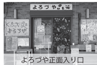
よろづや正面入り口