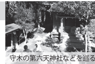
守木の第六天神社などを巡る