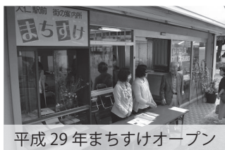
平成29年まちすけオープン