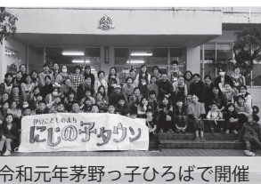
令和元年茅野つ子ひろばで開催