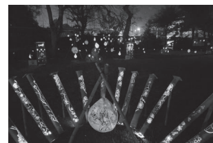
▲ 江川邸竹灯り実行委員会 『灯そう 2023 江川邸の庭へ』