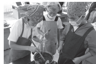
▲ NPO 法人あしづね舎 手作りみそで調理(長岡北小)

行政単独、または市民だけでは解決できない地域課題の解決に向けて、不足部分を補い合いながら行政と市民団体が対等な立場で役割を担って協働で取り組む活動です。