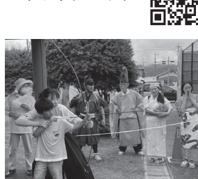
▲ 江間郷土研究会 『第2回義時・江間まつり』