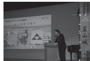
▲ 葦山城 早雲公を顕彰する会 『葦山城まつりイベント』