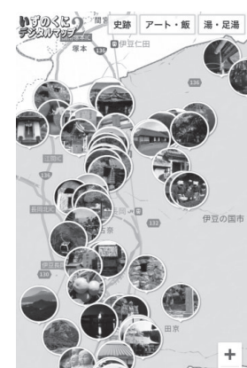
▲ 知半アートプロジェクト 委員会 デジタルマップ