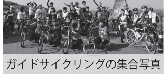
ガイドサイクリングの集合写真