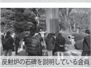
反射炉の石碑を説明している会員