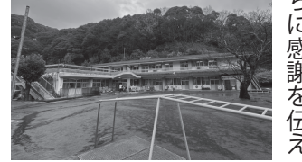
▲閉園した長岡保育園

表紙より 3月26日、長岡保育園閉園式が行われました。伊豆長岡地区の子どもたちの保育の場であった長岡保育園は、今年3月で閉園。92年の歴史に幕を閉じました。閉園式には、園児に加え卒業した小学生も参加し、お世話になった保育園や関係者たちに感謝を伝えました。 4月からは長岡幼稚園と統合し、新たに「にじいろこども園」が開園しました。