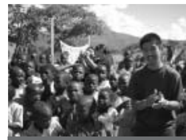
親を亡くした孤児たち。エイズは家族にも被害を及ぼす

ラウイ各地でイベントが行われ、僕も参加しました。以前は世界エイズデーの存在すら知らなかった僕ですが、この国に来てからはエイズとは切っても切れない関係になっていきます。数カ月前からは、エイズ感染者のグループ活動にも参加し、彼らと一緒にチャリティイベント等を開催しています。初めてそのグループの顔合わせに参加したとき、代表者の人から「ここにいる人は、君以外は全員エイズ感染者だ！」と言われ、百人近い人の中で非感染者は僕一人かあと思つたら、一瞬ゾツとしたのが本音です。だけど彼らの明るい表情や元気な姿に接していくうちに、エイズと戦う同志になれたような気がします。最近、直属の上司がエイズ感染者であることがわかり、また職場の同僚がエイズで亡くなり、改めてエイズの拡大と脅威を認識したところです。