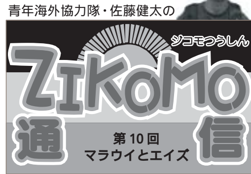
ZIKOMO...マラウイ語で「どうも」の意味

正しい知識を持たない人が多く、結果としてエイズに感染し、感染者に対する偏見も多いのです。そのような人々を減らしていくことが使命であり、イベント等を開催していく目的でもあります。