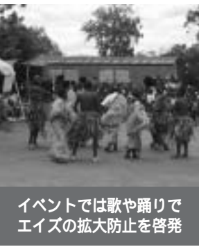
イベントでは歌や踊りでエイズの拡大防止を啓発