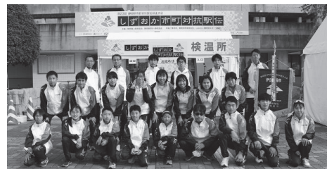
▲昨年の選手の皆さん