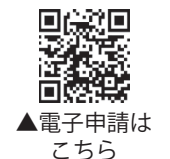
▲電子申請はこちら

【6026コンクール】 対象／満60歳の人(昭和38年4月1日～昭和39年3月31日生まれの人)で自分の歯が26本以上ある人 受診締切／7月31日(月)まで 【8020コンクール】 対象／満80歳以上の人(昭和18年4月1日以前に生まれた人)で自分の歯が20本以上ある人 受診締切／6月30日(金)まで その他／入賞者は広報で発表予定です。後日、賞状と記念品を贈呈します。