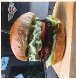
キッチンカー 屋台