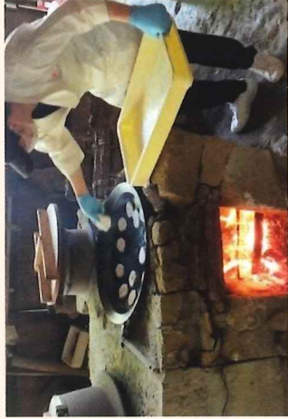
江川邸内・土間のカマドで パン焼き実演