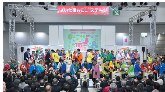
2024年の“よい仕事おこし”フェアでは過去最多となる253の信用金庫が協賛しています。

日本を明るく元気にするためには、地域経済が活性化していく必要があります。全国の信用金庫のネットワークを有効に活用した当フェアの開催を通じて私たちが大切なお客様同士の懸け橋となり地域の「よい仕事おこし」を全力で応援いたします。