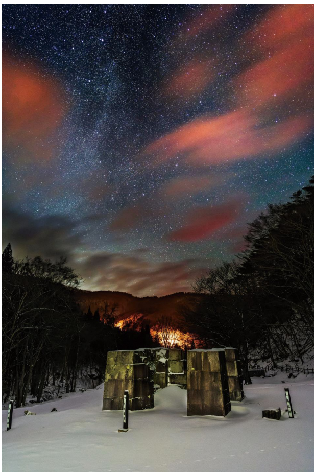
「悠久のたたら場跡と星空」