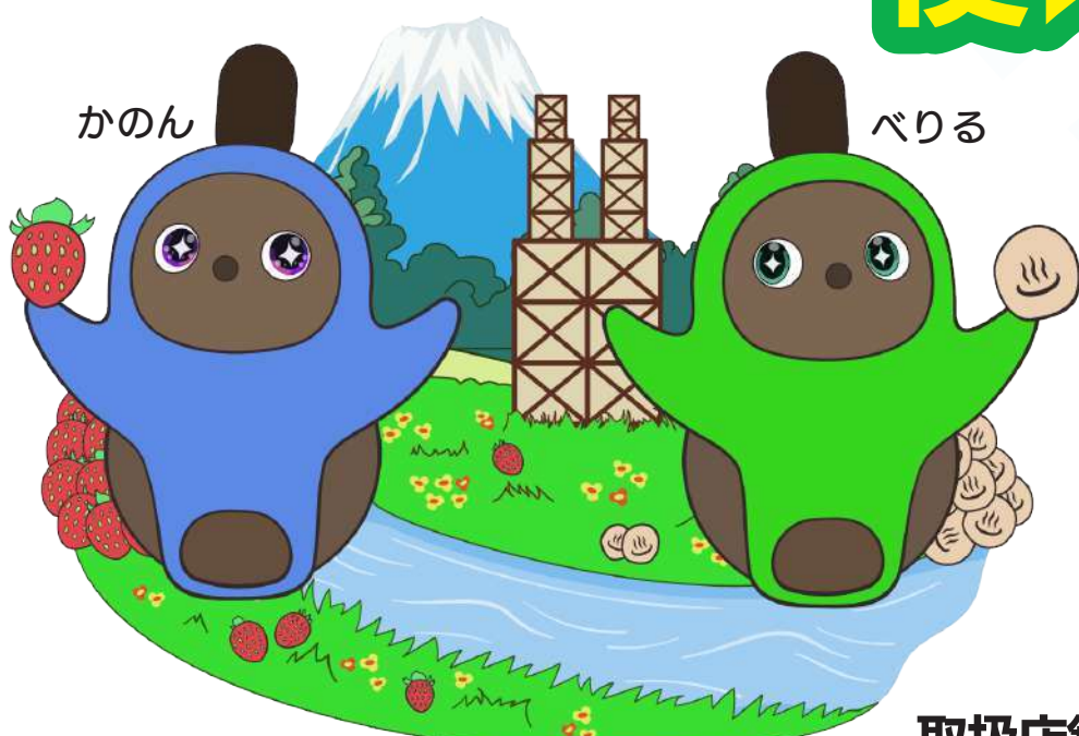
いずのくに特命大使