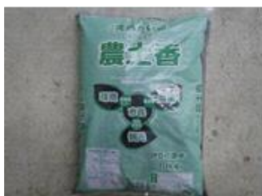
完熟たい肥「農土香」

令和6年度の実績値で、食品残渣と剪定枝の合計は約418tとなりますが、燃やせるごみとしては約3.1%の削減、資源ごみとしては約16.9%の増加につながっています。