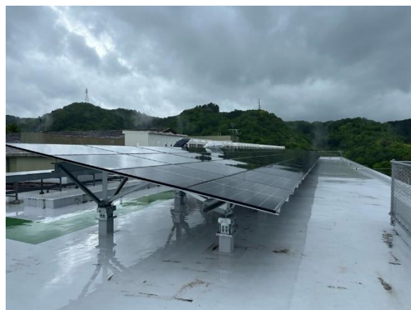
大仁中学校(屋上)の太陽光パネル

(大仁中学校の契約では、契約期間を20年間とし、期間満了後、太陽光発電設備は市に無償譲渡されます。)