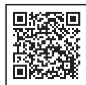
▲市公式 ウェブサイト 通知設定方法