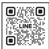
▲市公式 LINE 友だち追加

市公式LINEに登録すれば、本冊子に記載の「ごみの分け方・出し方」が品目名で検索できるようになります。また、翌日が何のごみの日か前日に通知が届くように設定できます。ぜひ登録して、ごみの分別収集にご協力ください。