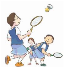
ファミリーバドミントン