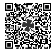
▲活動団体について