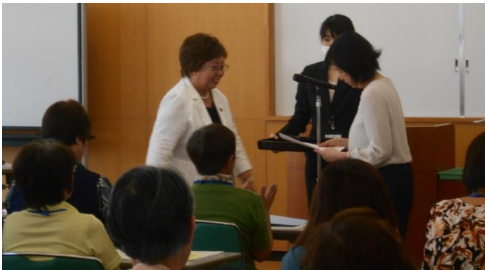
(総会の様子:小野市長より委嘱状の交付)

新しい委員となり、今年度はスキルアップ研修を行っています。学んだことを委員自身が実践したり、家族や身近な方、地区の方へ伝える活動をしています。