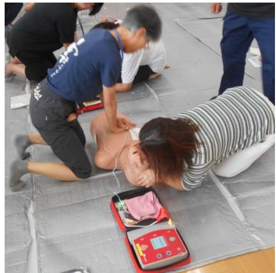
(研修会の様子:心肺蘇生法と応急手当)

保健委員として私達が学んだ知識や情報を区の皆様に積極的に伝えていこうと思う体験になりました。