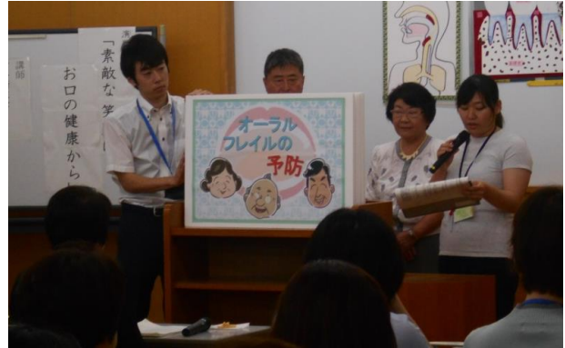
(研修会の様子:素敵な笑顔はお口の健康から)