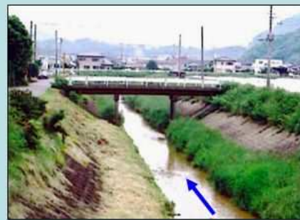
改修前 例) 田中橋