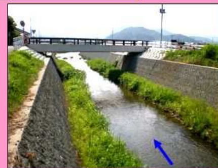
改修後 例) 田中橋