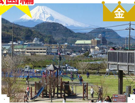
金 ②狩野川リバーサイドパーク