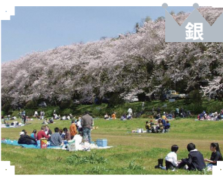
銀 ④守山西公園・狩野川さくら公園