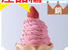
金 ②大福 銀 ⑥ケーキ 銅 ①ソフトクリーム ※写真はイメージです