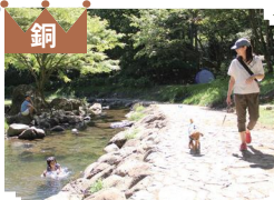
銅 ⑥市民の森 浮橋

子どもを連れてよくリバーサイドパークを利用します。子どもたちの笑顔があふれる平和な景色が大好きです！