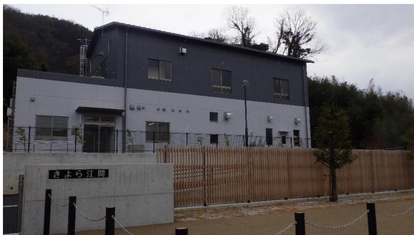
新し尿処理場 きよら江間

【事業内容】新しく整備したし尿処理場の外構に、市内で生産した間伐材を活用した木柵を設置し、市内の森林整備についてPRを行った。