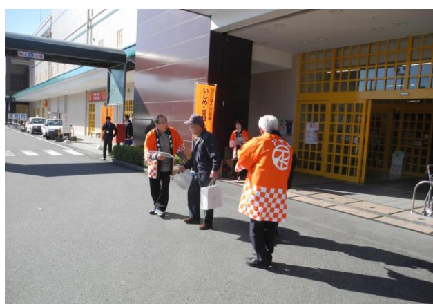
虐待防止月間告知チラシ及びステッカーを商業施設前で配布