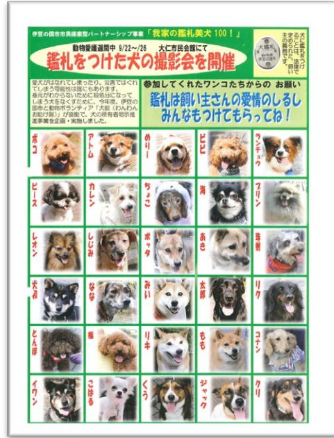
商業施設での展示会