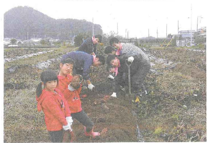
サツマイモの収穫