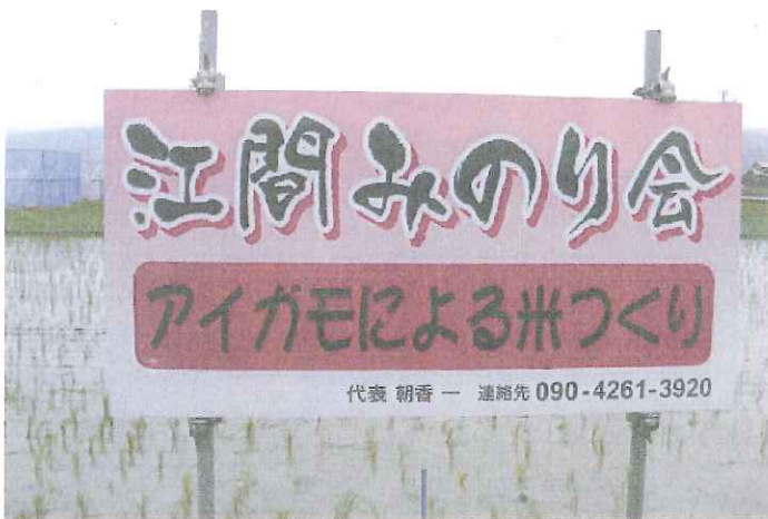
田に立てられた「江間みのり会」の看板