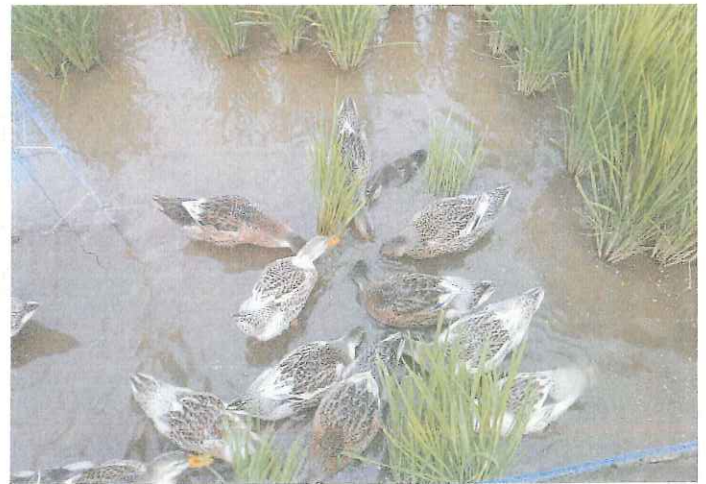
アイガモ農法はアイガモが虫や草を食べ、その排泄物が養分になる無農薬農法