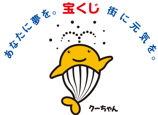
宝くじの広報マーク

* 申請をしても必ず採択されるということではありません。 （一財）自治総合センターで審査をして採択の決定をします。採択の決定は令和7年3月末となる予定です。