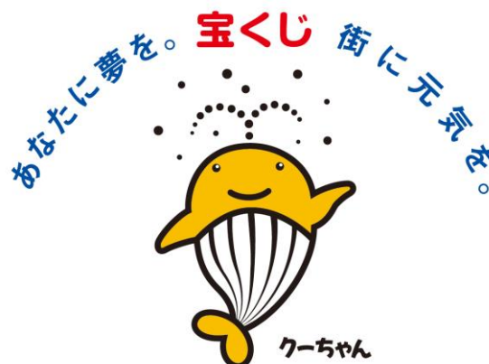
宝くじの広報マーク

*申請をしても必ず採択されるということではありません。（一財）自治総合センターで審査をして採択の決定をします。採択の決定は令和6年3月末となる予定です。