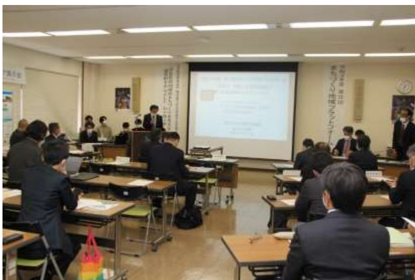
開会・伊豆の国市都市整備部長あいさつ