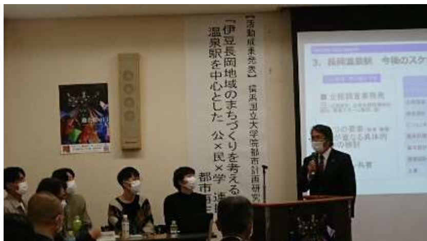
伊豆の国市 山下市長の感想及び御礼