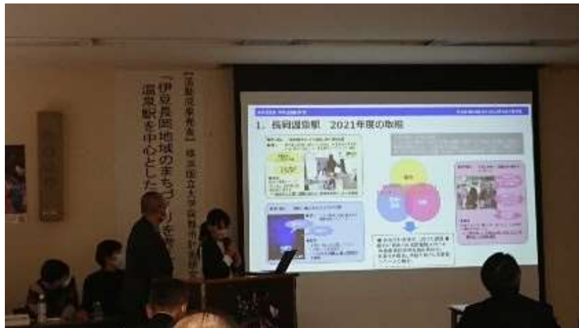
伊豆箱根鉄道(株)の取組みと今後の方向性について