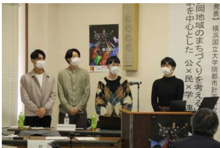
横浜国立大学院都市計画研究室大学生の発表