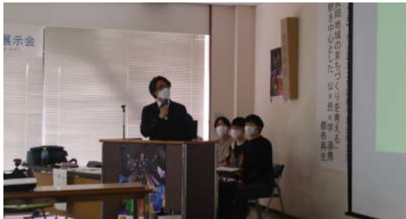
横浜国立大学院都市計画研究室 野原先生からの総括・まとめ