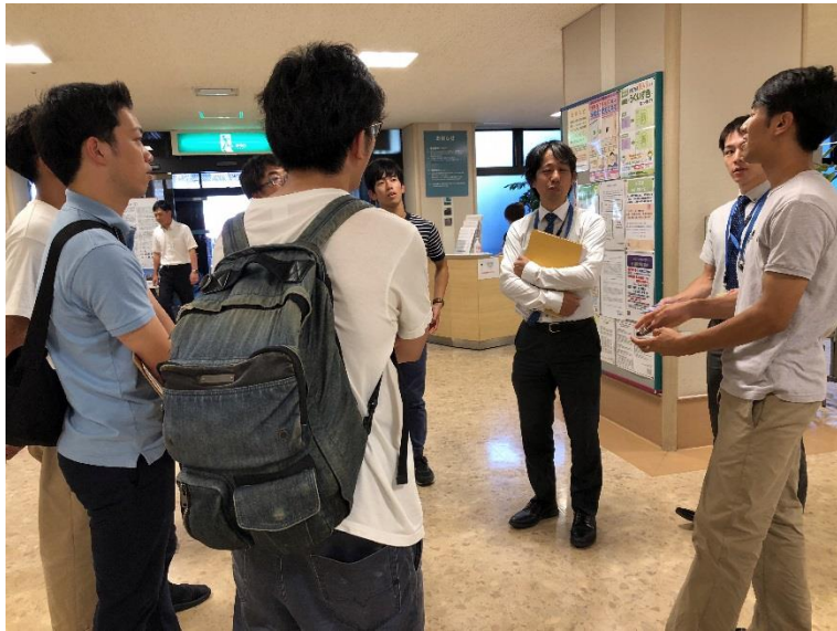
順天堂大学医学部附属静岡病院内