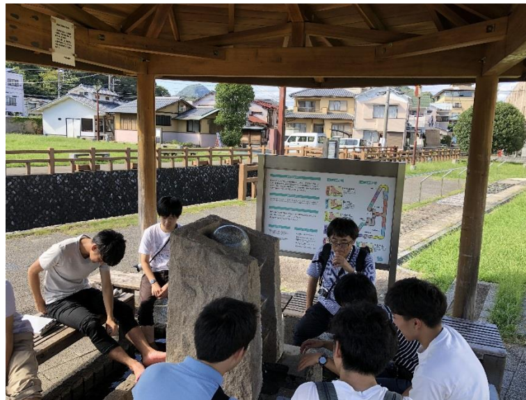
湯らっくす公園の足湯