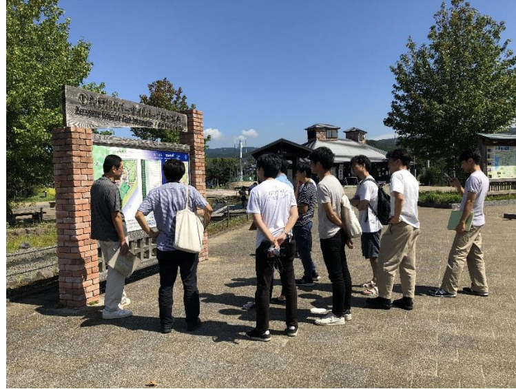
狩野川リバーサイドパーク