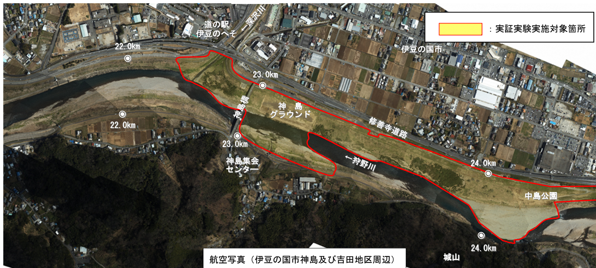
航空写真（伊豆の国市神島及び吉田地区周辺）